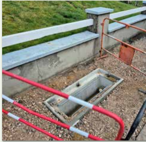
Enfouissement des réseaux rue de Neufchâtel