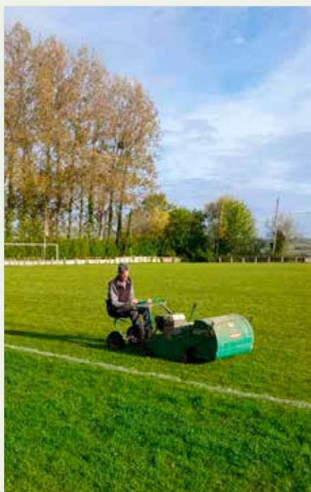
Entretien du stade Ansart