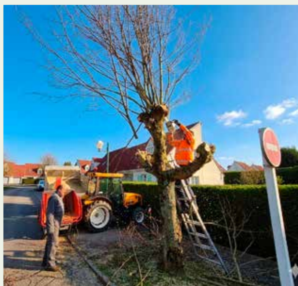
Entretien des espaces verts