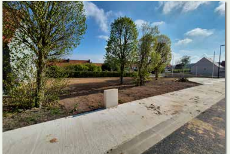
Semis du gazon à la résidence Rosa Bonheur