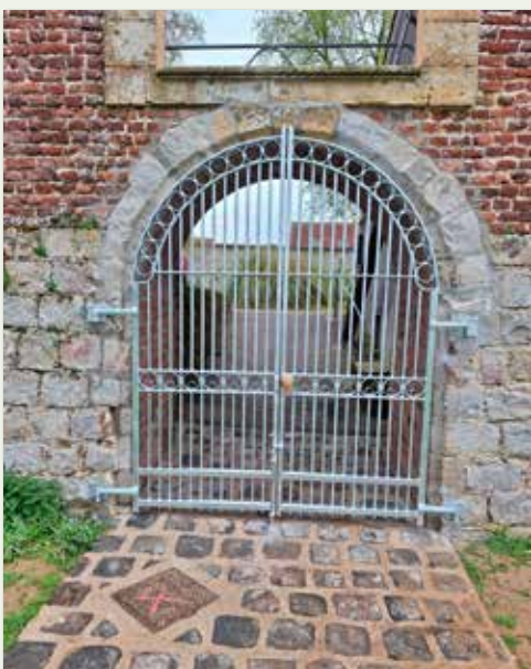
Pose d'une grille aux Jardins de l'Abbaye