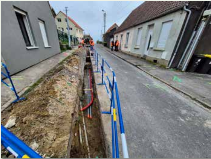
Début des travaux d'enfouissement des réseaux rue de Questrecques