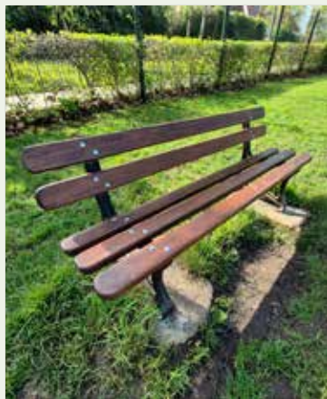
Entretien des bancs et des aires de jeux