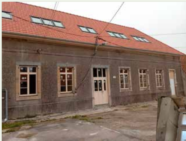
Pose de menuiseries à l'ancienne école Place de l'Abbaye