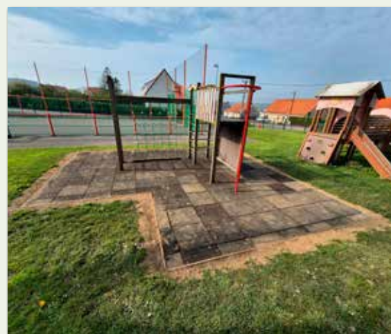
Remplacement de dalles pour les jeux au jardin public