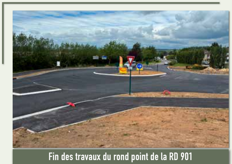
Fin des travaux du rond point de la RD 901