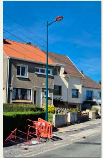
Pose de nouveaux candélabres rue de Neufchâtel