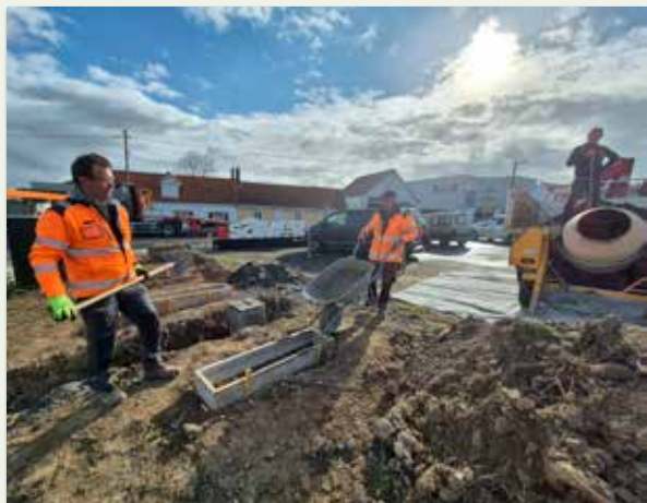
Création de dalles béton pour le nouvel emplacement du #samer