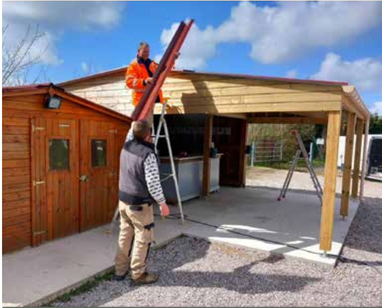
Réalisation d'un auvent aux terrains de pétanque