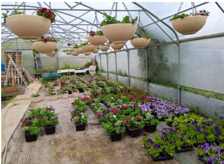
Préparation des fleurs pour le fleurissement de la ville