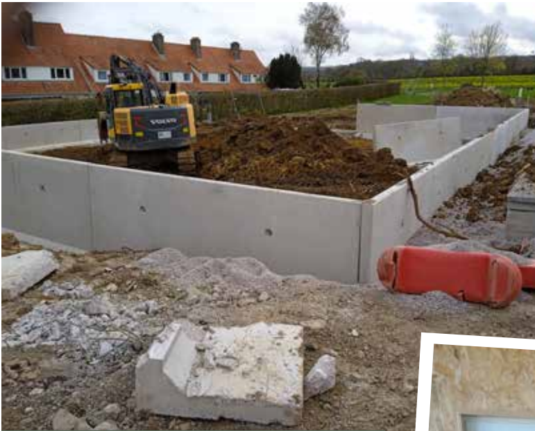
Réalisation de la voirie et de l'assainissement résidence Rosa Bonheur pour la construction de 7 lots libres