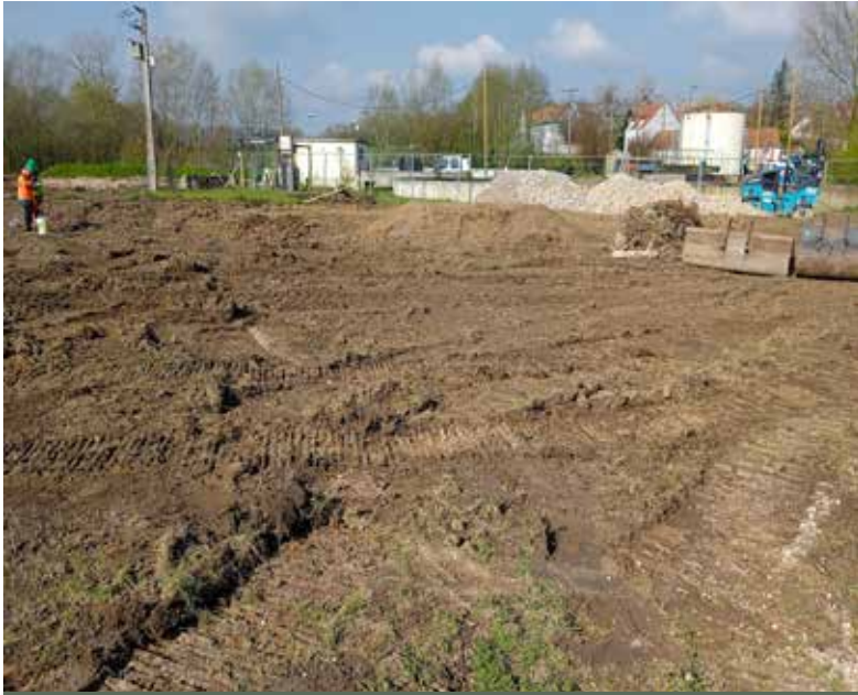
Début des travaux de la station d'épuration - 5 800 000 €