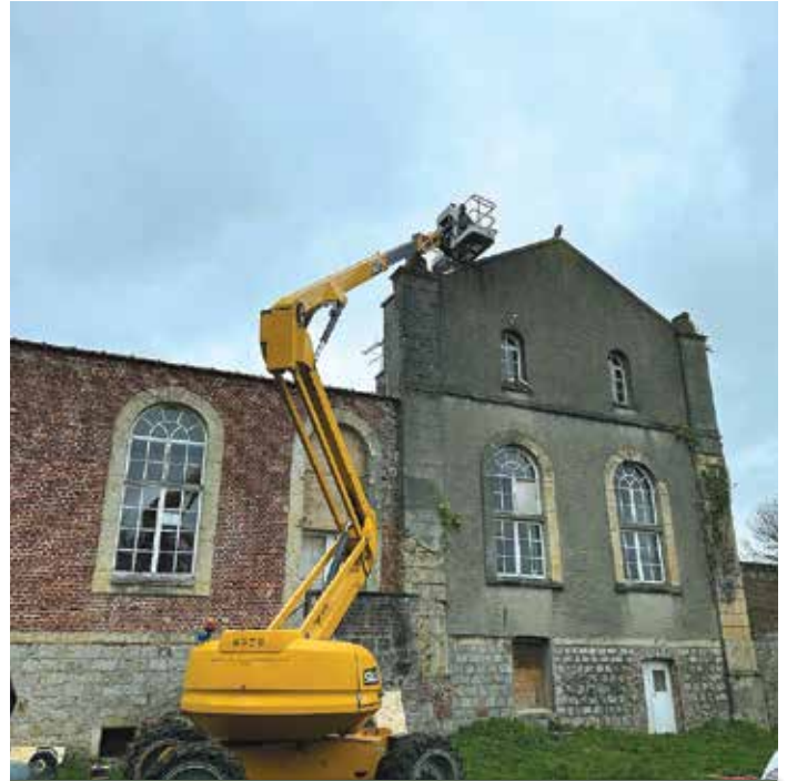
Réparation de la toiture à la maison de l'Abbaye