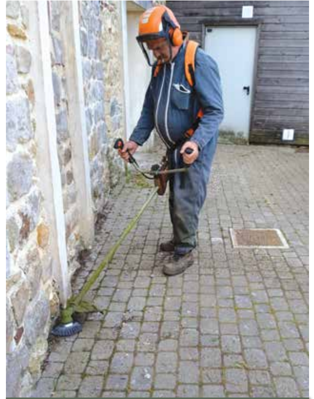
Entretien de la ville