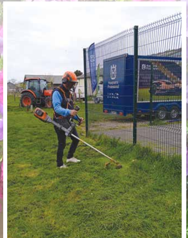
Entretien des espaces verts