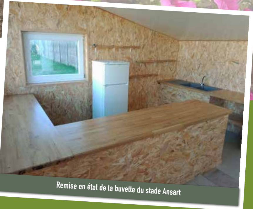
Remise en état de la buvette du stade Ansart